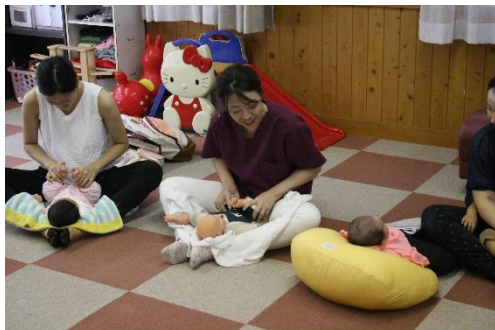
子育てサロン活動

和歌山でご協力頂いた赤い羽根共同募金は和歌山の町を良くするために役立てさせて頂いております。ありがとうございます。