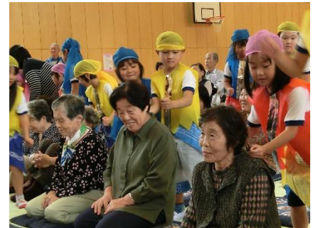
児童・高齢者交流会