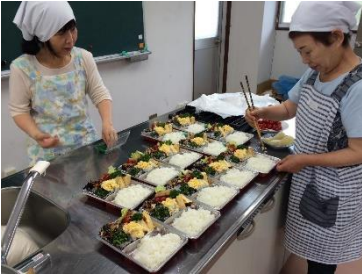
給食サービス・安否確認