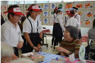
笑顔あふれるこどもカフェ