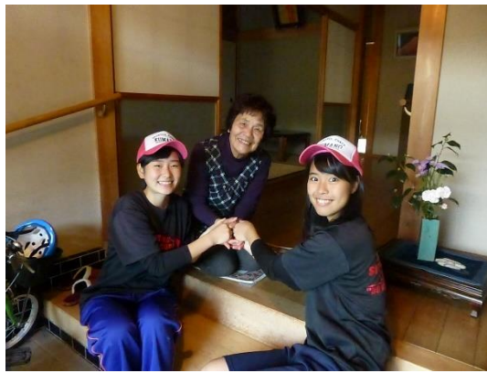
ハートフルチェック高齢者声掛け訪問