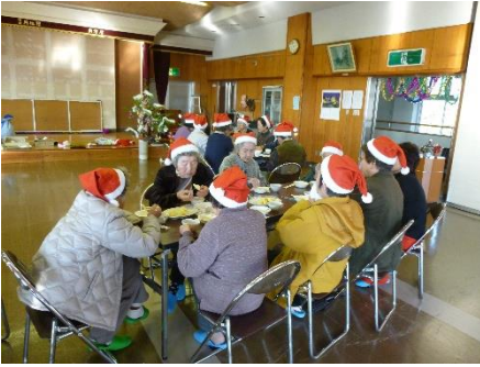
高齢者サロン活動