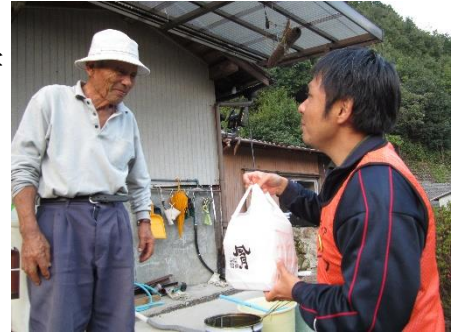
災害ボランティア活動支援