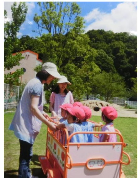
災害時には避難車に