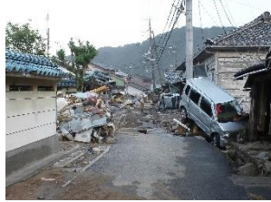
平成 23 年台風 12 号災害